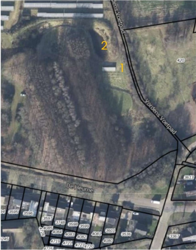
Huidige locatie met locatie 1: zonnepanelen en 2: poel